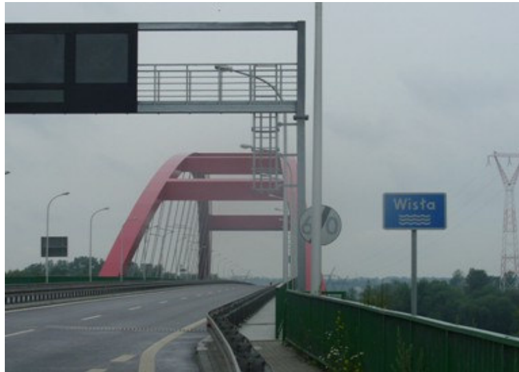
Rys. 2. Nowy most w Puławach z systemem monitoringu